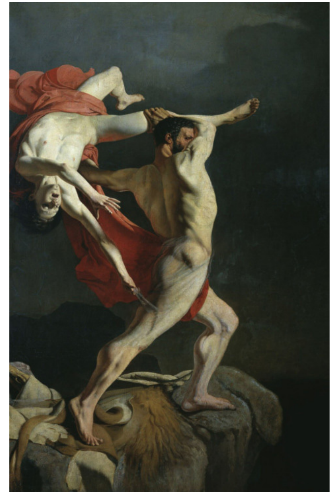
L'expulsion de Lichas dans l'Eubée

Aujourd'hui cette question est plus que jamais d'actualité. Alors qu'un nouveau projet de loi prévoit d'augmenter encore le délai de rétention jusqu'à plus de trois mois, qu'il s'agit désormais de trier les mi-